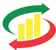
BSTPE BOURSE DE SOUS-TRAITANCE ET DE PARTENARIAT D'ENTREPRISES