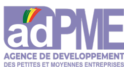
adPME AGENCE DE DEVELOPPEMENT DES PETITES ET MOYENNES ENTREPRISES