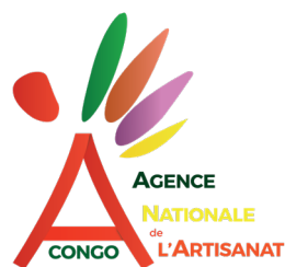
AGENCE NATIONALE de L'ARTISANAT CONGO