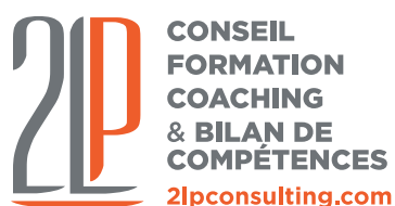
CONSEIL FORMATION COACHING & BILAN DE COMPÉTENCES 2lpconsulting.com